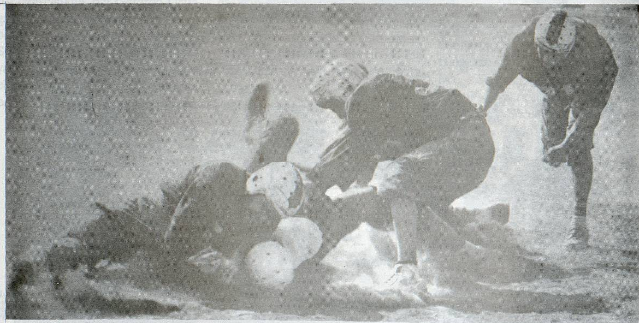
Una acción del encuentro donde empataron el EIAO y el Franco Mexicano.