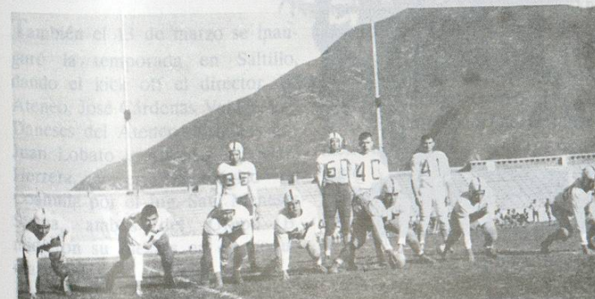
Tecnológico de 1954