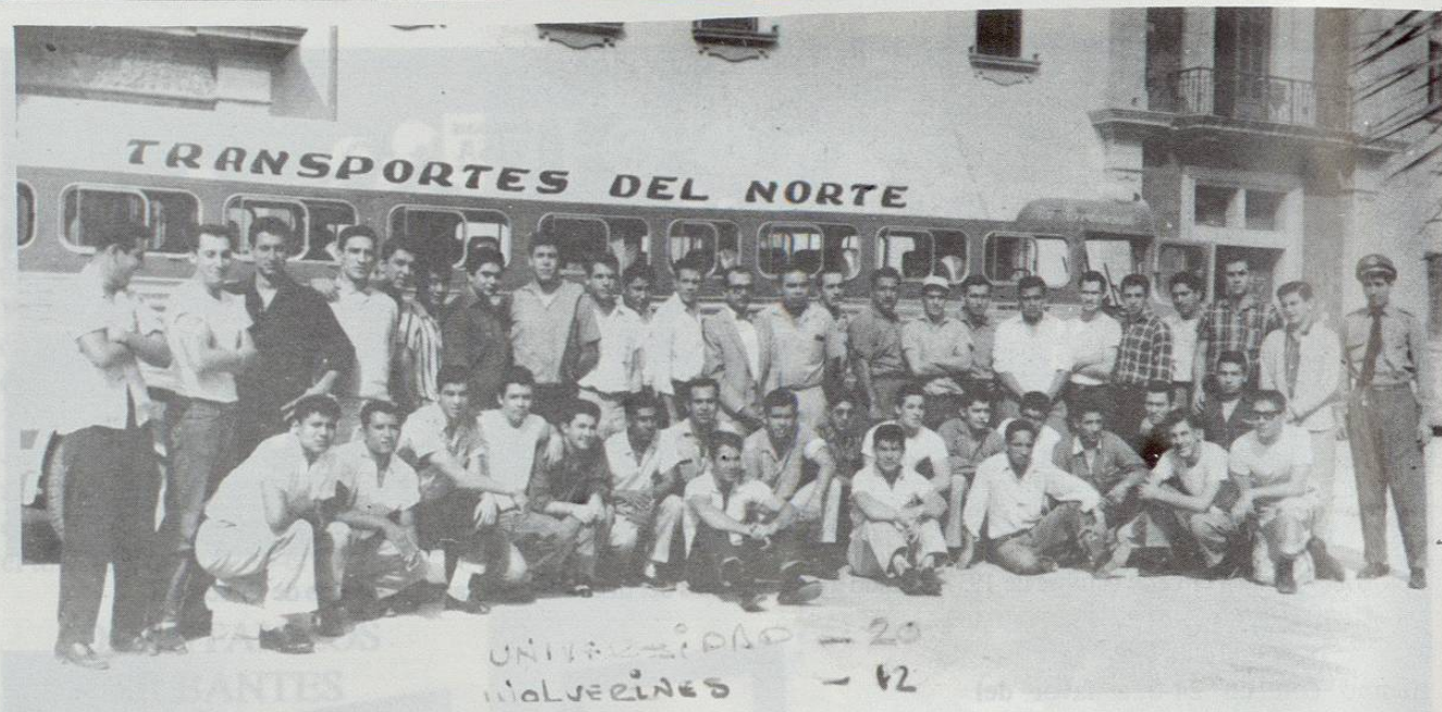
Antes de abordar el autobús que los llevaría a San Antonio Texas.