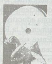
FULL BACK CARLOS ARGOTE A.M.M.