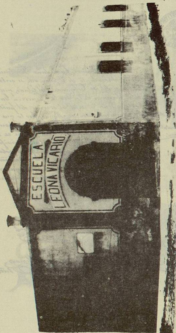
Antiguo Edificio de la Escuela de Niñas "Leona Vicario".