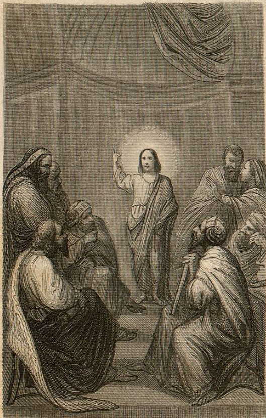
JESUS CON LOS DOCTORES.