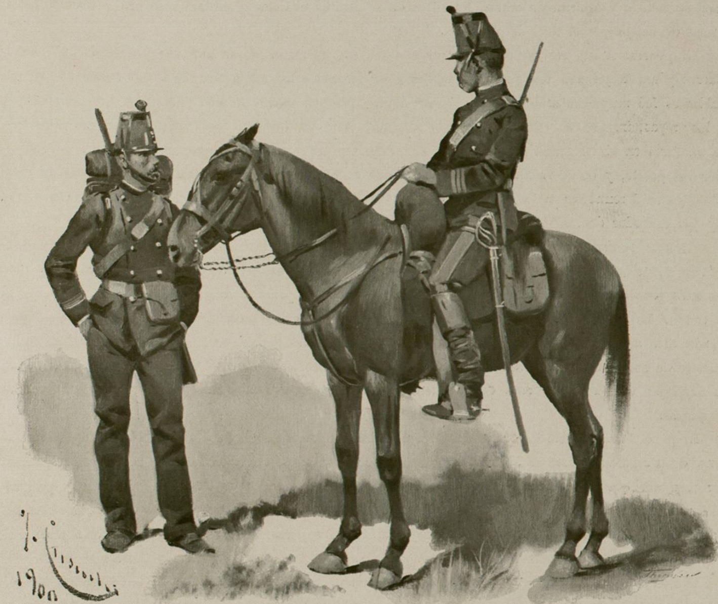
Soldados de la época actual

El día 20 de Julio se embarcaron en Veracruz las últimas tropas invasoras que habían penetrado hasta el Valle de México.