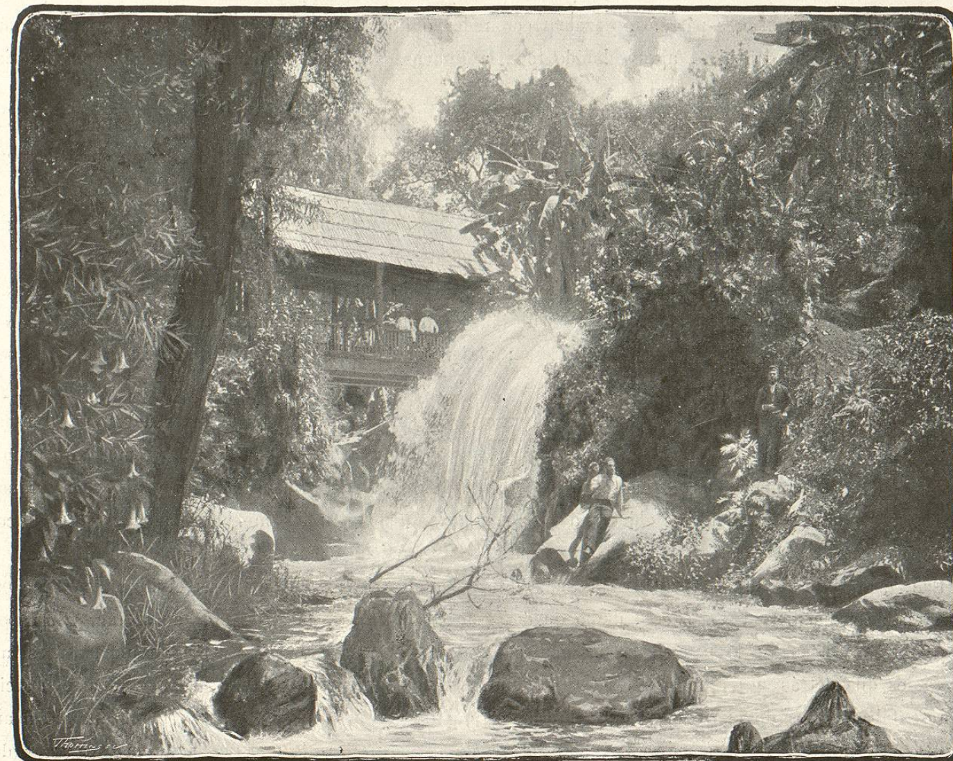
Michoacán.—Uruapan. Río Cupatitzío. Salto de Camela

Brillantemente ataviadas las clases superiores, el plebeyo estaba sometido á una legislación suntuaria que le impedía usar otras ropas que las tejidas con la fibra del maguey y las corrientes de algodón; el tilmatti y el maxllatl , de vistosos colores, con cenefas y adornos finamente elaborados, pertenecían exclu-