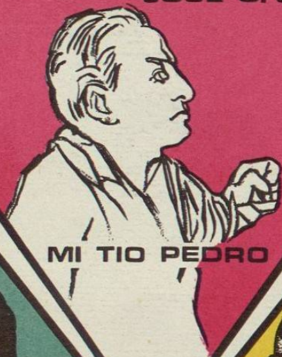
MI TIO PEDRO