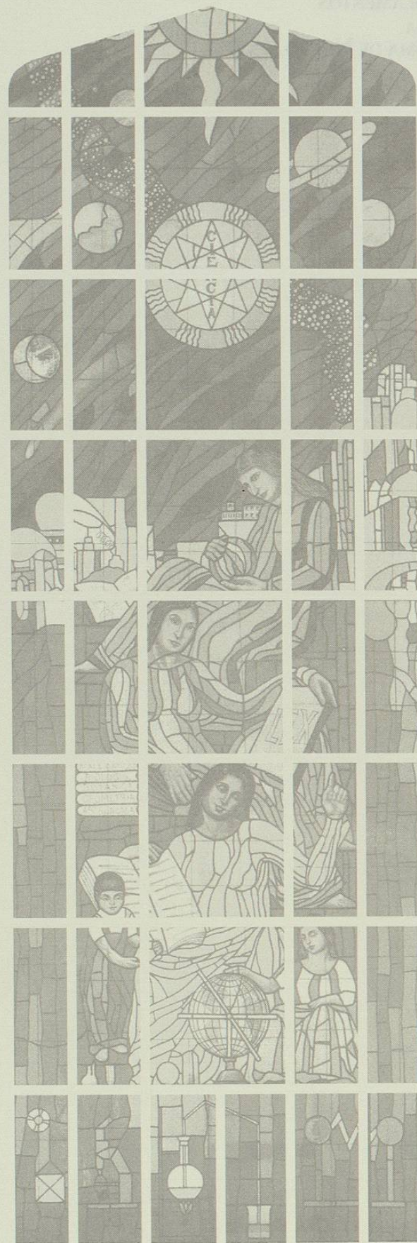
Vitral de Roberto Montenegro -Aula Magna "Fray Servando Teresa de Mier", UANL