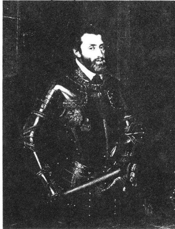
Retrato de Juan Pantoja de la Cruz. Monasterio de San Lorenzo de El Escorial, Madrid.

20. Carlos III (Madrid 1716 - Madrid 1788)