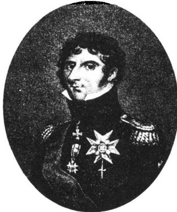
Grabado sobre el retrato de J. W. Bollinger.