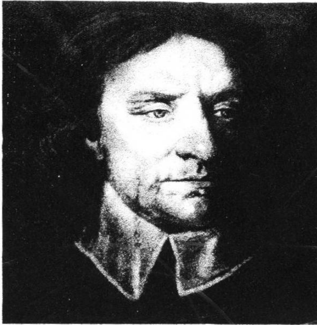
Dibujo al pastel de Samuel Cooper. Sidney Sussex College, Cambridge