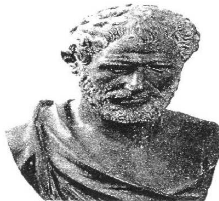
Busto en bronce de Aristóteles. (Museo Nacional, Nápoles) [EH]

Es probablemente el pensador más influyente de la civilización occidental. Era hijo de un médico, de quien le vino quizá su interés por la ciencia; se educó en Atenas, asistiendo entre los 17 y los 37 años a la Academia de Platón. En el 342 a. C., ya muerto su maestro, regresó a Macedonia, para ejercer como preceptor del príncipe heredero del Trono, el futuro Alejandro Magno. Tras la coronación de éste en el 335, Aristóteles volvió a Atenas, donde abrió su propia escuela -el Liceo-, en donde enseñaba a sus alumnos paseando (de ahí el nombre de «escuela peripatética»). Su obra escrita abarcó hasta 170 libros, de los que 47 han llegado hasta nosotros; tratan de los temas más diversos, desde física, anatomía, zoología, geología o astronomía hasta ética, metafísica, lógica, teología, economía, política, retórica o estética. Aristóteles se convirtió en la máxima autoridad en todos los campos del saber de la Antigüedad, mediante una mezcla de compilación de las aportaciones de otros, descubrimientos del grupo de ayudantes que trabajaban para él e ideas originales propias. La protección de la que gozó Aristóteles por parte de Alejandro, si bien le facilitó la conclusión de su obra, le ganó la enemistad del partido antimacedonio que, tras la muerte de Alejandro en el 323, se adueñó de Atenas; acusado de «impiedad», huyó de la ciudad para evitar una muerte como la de Sócrates, y murió poco después en el exilio. [PH, 43]