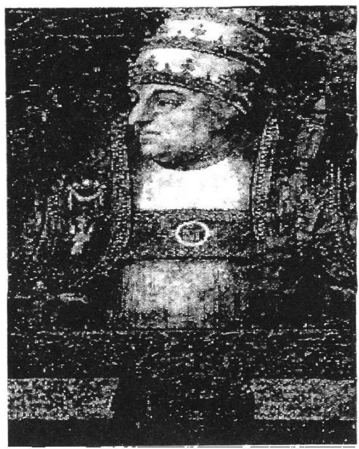
Alejandro VI, el papa Borgia [EH]

Papa que perteneció a la familia de los Borja o Borgia. Hizo una rápida carrera eclesiástica basada en intrigas, bajo la protección de su tío y padre adoptivo, Calixto III, quien lo nombró cardenal en 1455. Más tarde, en 1492, fue elegido papa. Su vida disoluta y su ambición fueron denunciadas por Savonarola, reformador florentino a quien excomulgó, torturó y ejecutó en 1498. Utilizó los recursos de la Iglesia para enriquecer a su familia y situar a sus ocho hijos ilegítimos. Se vio obligado a defender su independencia frente a la amenaza de Francia, y para ello conformó la Liga de Venecia (1495), con los soberanos de Milán, Venecia, Austria y España. A cambio del apoyo militar, los Reyes Católicos obtuvieron las Bulas alejandrinas (1493), también llamadas bulas "Inter Caetera", que preservaban para España las tierras descubiertas en América. Alejandro VI es un prototipo del hombre del Renacimiento, que unía a su estilo de vida lujosa y corrompida la protección del arte y una cierta tolerancia. A su mecenazgo se debe La Piedad de Miguel Ángel. [PH, 17]