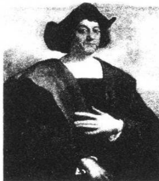
Óleo atribuido a Sebastiano del Piombo (1519).