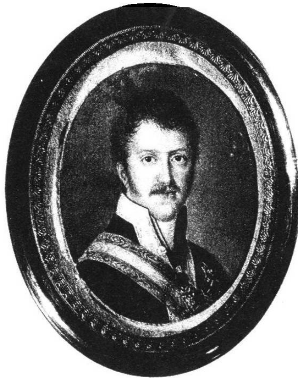
Museo Lázaro Galdiano, Madrid.

19. Carlos I (V del Sacro Imperio Romano)