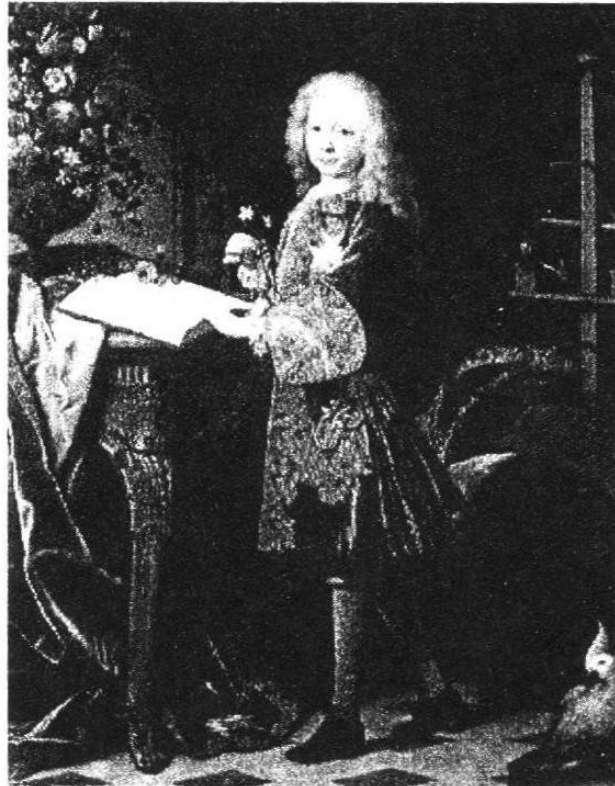
Carlos III retratado de niño por Jean Ranc (Museo del Prado, Madrid)

En cuanto a la política exterior, intentó mantener el prestigio español y su presencia colonial, amenazada por el expansionismo de Gran Bretaña y Francia, principalmente. Para ello, reformó el ejército e incrementó el poder naval español, hasta el punto de que pudo ser considerada en su época como la más poderosa después de la británica. Económicamente hay que recordar a este monarca porque tendió a unificar el sistema monetario creando el primer papel moneda y la primera banca estatal (Banco de San Carlos 1782). En política exterior fueron fundamentales tres puntos u objetivos: Paz en el Mediterráneo para garantizar el comercio español en a favor, neutralizar a Gran Bretaña en las colonias americanas y recuperar Menorca y Gibraltar de manos de los ingleses, conseguiría recuperar la primera plaza, pero no así la segunda que sigue siendo colonia británica. Murió en 1788 sucediéndole en el trono su hijo Carlos IV. [PH, 118]