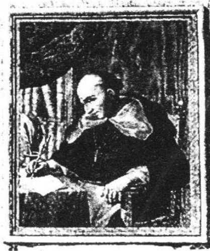
Bartolomé de las Casas. [EH]

transmitir a las autoridades las quejas de la población indígena de América. Publicó en 1552 una serie de escritos críticos, entre los que destaca Brevísima relación de la destrucción de las Indias . [PH, 377]