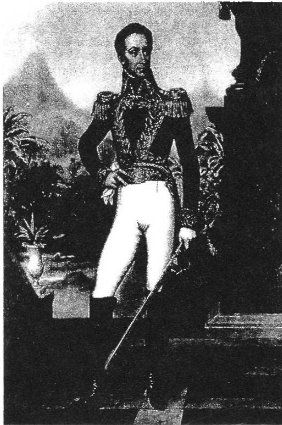
Retrato de Paulen Guérin de 1842. Ministerio de Asuntos Exteriores, Caracas.