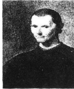
Maquiavelo, retrato de Santi di Tito. (Palazzo Vecchio, Florencia) [EH]