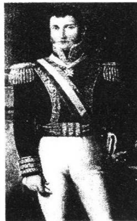
Agustín de Iturbide. Enciclopedia Hispánica

preeminencia de la Iglesia católica. El apoyo de los grupos sociales dominantes permitió a Iturbide hacerse dueño del país con facilidad; el último virrey español, Juan O'Donojú, sin fuerza militar que oponer, no pudo más que negociar el Tratado de Córdoba (1821), por el que reconocía la independencia de México como una monarquía a cuyo frente se pondría un príncipe de la Casa de Borbón. Sin embargo, el rechazo de los Borbones para aceptar el Trono mexicano hizo que las Cortes de aquel país nombraran una regencia de cinco miembros encabezada por Iturbide. Posteriormente sería proclamado emperador de México con el nombre de Agustín I (1822), al no reconocer el gobierno español el Tratado de Córdoba. La política imperial se encaminó a consolidar el poder y la pompa de la nueva monarquía, al tiempo que intentaba sin éxito extender su dominio hacia Centroamérica. Quiso liquidar su continua confrontación con la oposición liberal y republicana disolviendo el Congreso en 1822, lo que provocó un levantamiento militar contra él, encabezado por Santa Anna. Iturbide hubo de dimitir (1823) y se formó un régimen republicano federal. Desterrado en Italia, regresó a su país para ofrecerse a combatir ante la inminente llegada de una expedición de reconquista española; pero las autoridades republicanas interpretaron su regreso como un intento de recuperar el poder, le acusaron de traición y le hicieron fusilar. [PH, 32]