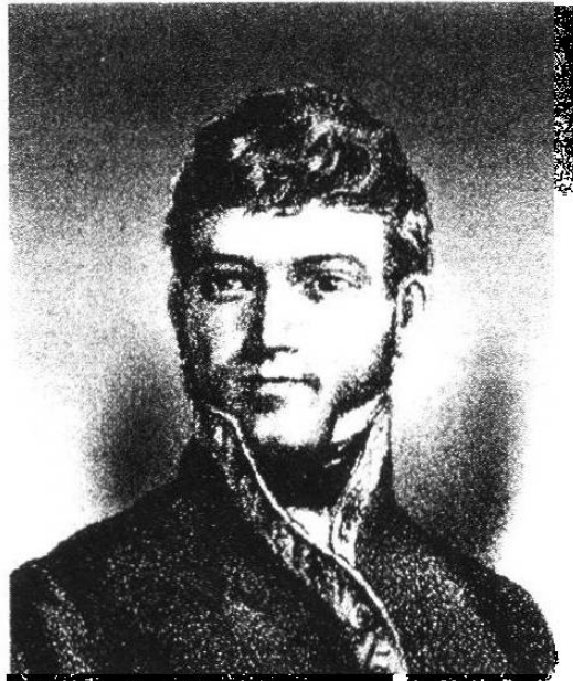
Xavier Mina [EM]

Constitución gaditana. Mina se volvió adversario feroz y apasionado del Fernando absolutista de 1814. Perseguido, tuvo que huir primero a Francia y luego a Inglaterra. En Londres conoció a fray Servando Teresa de Mier, con varias cuentas pendientes contra el régimen opresor de los dos últimos Borbones. Mier, intelectual atrayente e inquieto, convence a Mina de las bondades de una tesis peculiar: era legítimo combatir al absolutismo de Fernando en cualquier parte donde se luchara contra él, así en España como en las colonias; así pues, Mina podía prestar sus servicios a la causa insurgente en Nueva España. Mina aceptó esta idea. Así, con poco más de 300 hombres desembarcó el 15 de abril de 1817 en Soto la Marina con tres buques: el Cleopatra , el Neptuno y el Congreso mexicano . Obtiene varias victorias: el 8 de junio en Valle de Maíz; el 15 de junio en Peñillos (San Luis Potosí); en Real de Pinos, Zacatecas, el 19, y llega al fuerte del Sombrero el 24. El 7 de julio toma la hacienda del Jaral. El general Liñán sitia el fuerte del Sombrero el 1º de agosto; logra salir el 8 y contrataca sin efecto. Mina marcha al fuerte de los Remedios y es derrotado en la hacienda de la Caja. Es aprehendido por el coronel Orrantía en la hacienda del Venadito el 27 de octubre. Fue fusilado el 11 de noviembre de 1817 frente al fuerte de los Remedios, en el cerro del Bellaco, Guanajuato. [HM, 1712/ETV, 163]