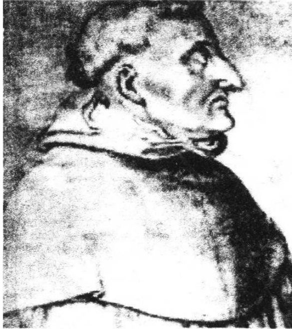
46. Gual, Pedro (Caracas, 1783 - Guayaquil, Ecuador, 1862)

una paráfrasis de las cartas de Pablo, y todo ello en lengua castellana. Otra gran influencia en fray Luis fue el místico Juan de Ávila, cosa que no hizo sino aumentar las sospechas de la Inquisición contra él. De hecho, fray Luis hubo de marcharse a Portugal seguramente para sustraerse a los manejos inquisitoriales que le habían puesto en la diana. Sus últimos años fueron de intenso sufrimiento, aumentado por el escándalo que se produjo con el denominado Suceso de la monja de Portugal , en el que fray Luis salió como cándido defensor de una monja iluminada, de la cual después se descubrió que todo era superchería y fraude. En la tierra de su exilio murió a los 84 años de edad. [FE]