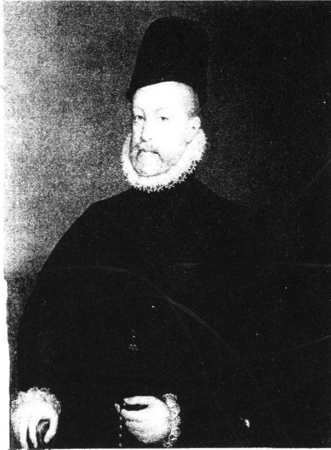
Retrato de S. Anguisciola. Museo del Prado, Madrid.