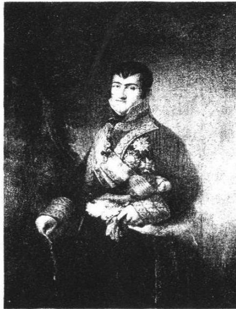
Retrato de Goya. Ministerio de Hacienda, Madrid.