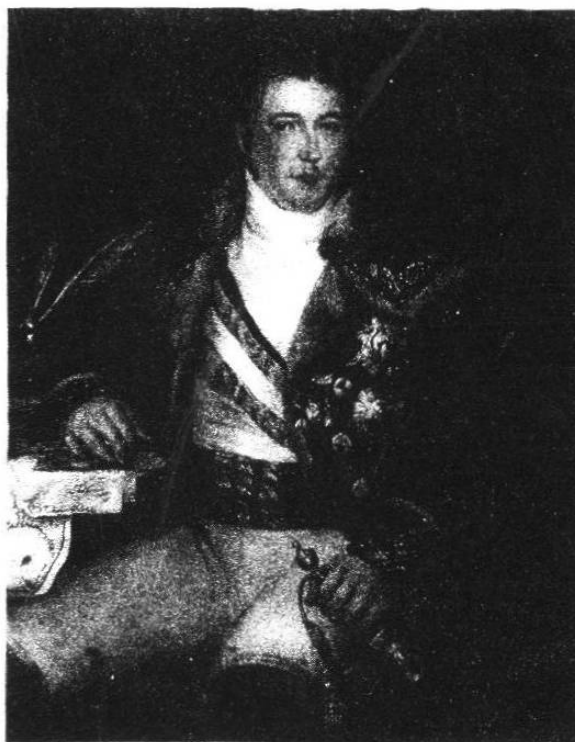
Retrato de A. Carnicero. Museo Romántico, Madrid.