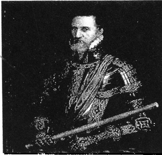
El duque de Alba. D. Fernando Alvarez de Toledo, por Tiziano. Palacio de Alba, Madrid.