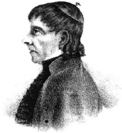
Fray Servando Teresa de Mier