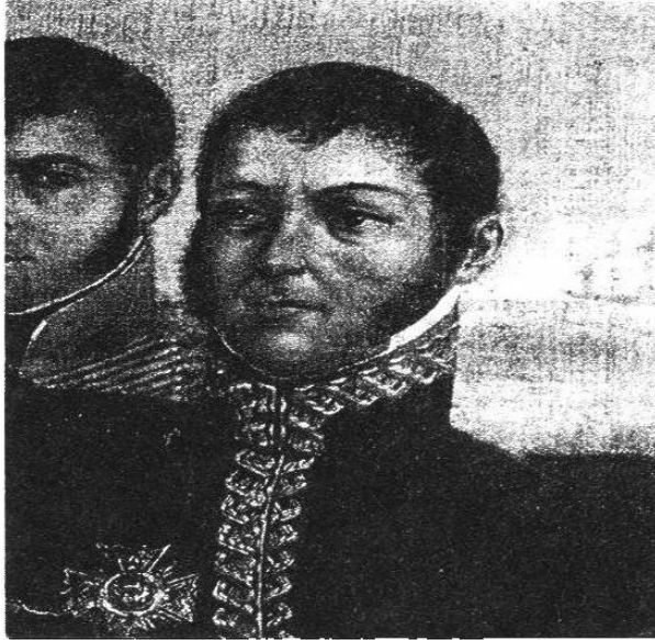
Detalle de El general San Martín con su Estado Mayor, anónimo del s. XIX. Museo de América, Madrid.