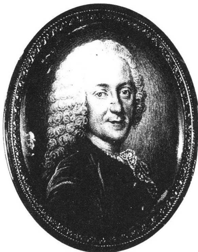
Miniatura. Museo Lázaro Galdiano, Madrid.