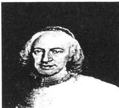
Detalle de un retrato del papa Pío VII. (Museo del Risorgimento, Venecia). [EH]

82. Pío VII (1740-1823) 87ª Pontífice de la Iglesia de Roma nacida en Cesena, Italia. Ingresó a la orden de los benedictinos y después de ser obispo en Imola y recibir el capelo cardenalicio, fue electo para regir los destinos de la Iglesia. Enfrentado a las tropas francesas que recorrían victoriosas casi toda Europa, el pontífice se vio obligado a firmar el Concordato de 1801 con Napoleón, y presidió la ceremonia de coronación del emperador en París (1804). En esa ocasión, el Papa debió aceptar los desplantes de Napoleón, quien se coronó a sí mismo y se negó a arrodillarse ante el pontífice. A raíz de la negativa del Papa de anular el matrimonio del hermano del emperador, los franceses se anexaron los Estados Pontificios y condujeron a Pío VII a Savona en calidad de prisionero. A su regreso a Roma, el Papa fue recibido con gran entusiasmo y dedicó sus últimos años a restaurar la unidad de la Santa Sede, revocando la disolución de la Orden de Jesús y promoviendo la difusión del catolicismo en América. [GH, 236]