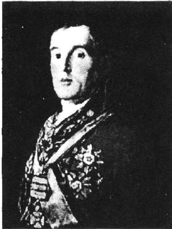
El duque de Wellington, retratado por Goya. (National Portrait Gallery, Londres) [EH]