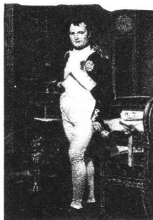
Napoleón en su gabinete de trabajo, de J.-L. David. The National Gallery of Art. Washington.

Restablecida en Francia la monarquía borbónica en la persona de Luis XVIII, la arbitrariedad y el revanchismo de los vencedores causaron pronto descontentos entre la población. Unido esto a las disensiones políticas que surgieron entre los antiguos aliados, Napoleón se decidió a intentar recuperar el poder. Escapó de su confinamiento y desembarcó en Cannes, reuniendo a sus fieles en apoyo del llamado Imperio de los Cien Días (1815). El rey huyó y Napoleón se puso de nuevo al frente del Estado y del ejército. Mientras intentaba ganarse a los franceses presentándose con un proyecto más liberal, preparó la inevitable confrontación militar contra los aliados. Ésta se produjo en la batalla de Waterloo (Bélgica), donde los aliados derrotaron definitivamente a Napoleón bajo el mando de Wellington. La segunda restauración castigó más duramente a Francia y a Napoleón, que fue desterrado en peores condiciones a la lejana isla de Santa Helena (océano Atlántico), bajo control británico. Allí permaneció hasta su muerte, viendo deteriorarse su salud gradualmente, al tiempo que dictaba al conde de Las Cases unas memorias en donde interpretaba su labor como un intento de continuar y consolidar la obra de la Revolución de 1789, añadiéndole una idea de orden y extendiéndola por el resto de Europa. [PH, 490]