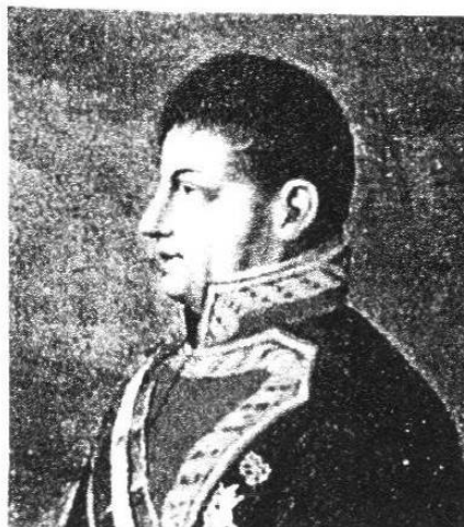
Juan O'Donojú, último virrey de la Nueva España.