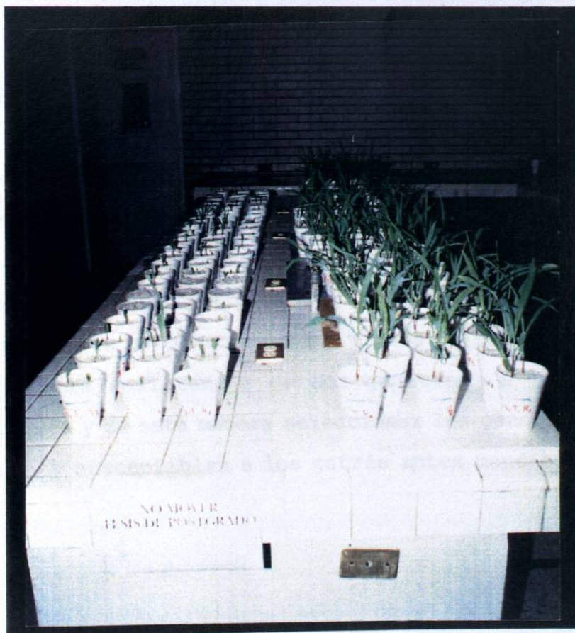
Fig. 1 Diseño experimental para el estudio de los 23 genotipos sometidos a diferentes factores de estrés.