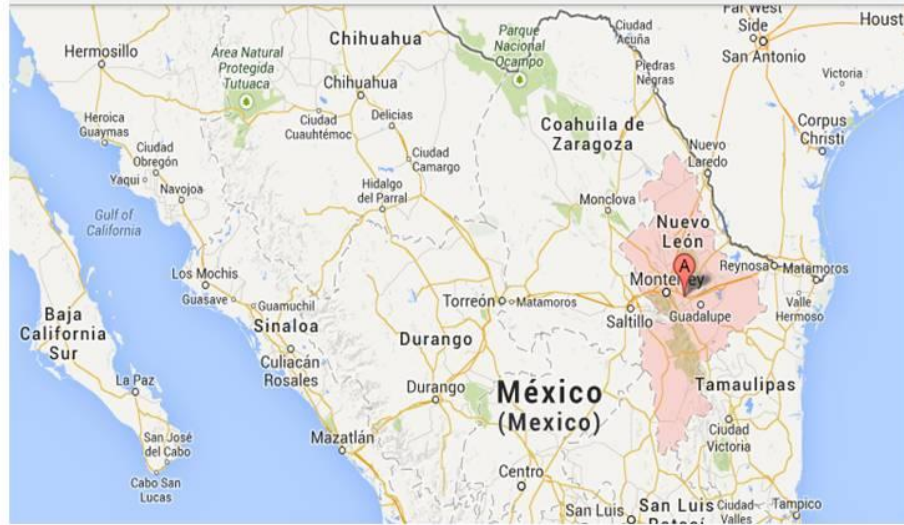
Figura 1 Ubicación geográfica del Estado de Nuevo León.