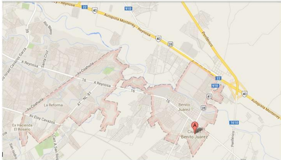
Figura 3 Ubicación geográfica de Juárez, Nuevo León.