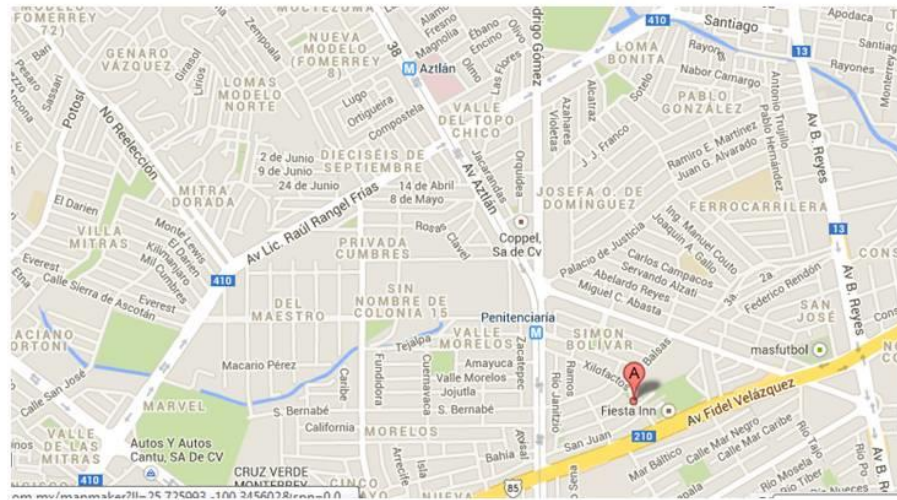
Figura 4 Ubicación geográfica de la colonia Josefa Ortiz de Domínguez en Monterrey, Nuevo León.