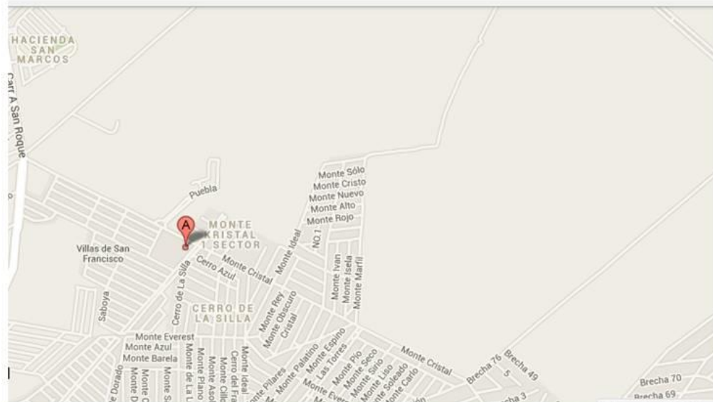
Figura 5 Ubicación geográfica de la colonia Monte Kristal en Juárez, Nuevo León.