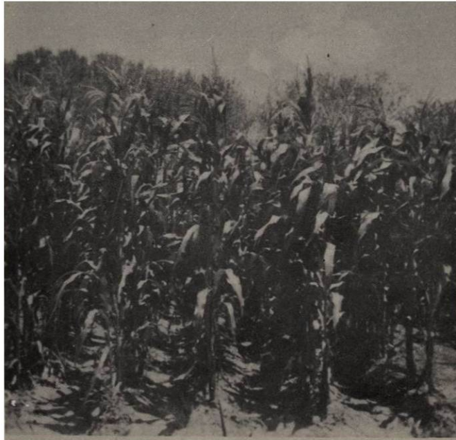
Figura 3. Aspecto de una parcela siempre limpia a los 75 días de la emergencia del maíz.