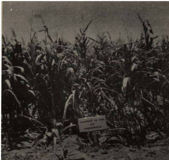
Figura 7.- Daños producidos por un viento que se presentó después de limpiar una parcela que se había mantenido enyerbada los primeros 60 días.