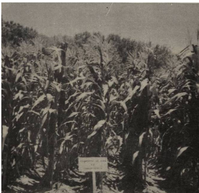
Figura 6.- Tratamiento enyerbado los primeros 35 días mostrando los síntomas de la competencia. ( a los 75 días de emergido el maíz).