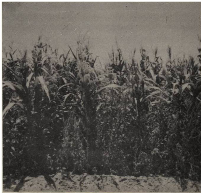
Figura 4. Aspecto de una parcela siempre enyerbada a los 75 días de la emergencia del maíz.