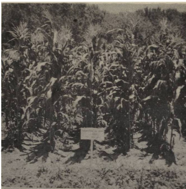
Figura 5. Tratamiento limpio los primeros 35 días mostrando un desarrollo normal. ( A los 75 días de la emergencia del maíz).